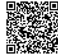
↑新潟市の子ども食堂 二次元コード

「地域にこんなしくみがあったら助かる！」 「支え合いの地域づくりについて知りたい！」 「地域のために、何か活動を始めたい！」と思ったときなど、いつでも私や地域づくり担当にご相談ください