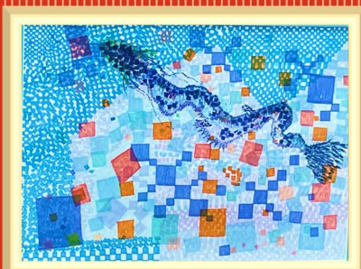
温泉で聞いた龍の音