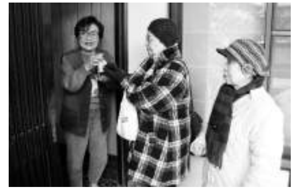
「訪問員さんの顔を見ると、ほっとします」と利用者さん