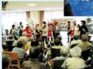
地域歳末たすけあい事業