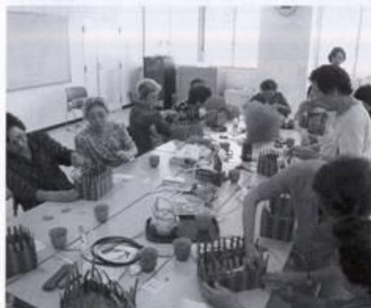
坂井輪ふれあいティールーム

ふれあいティールームとは60歳以上で要介護認定を受けていない方を対象とした、生きがいづくりと介護予防を目的とした事業です。