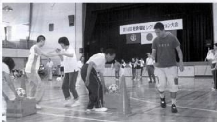
黒埼地区レクリエーション大会