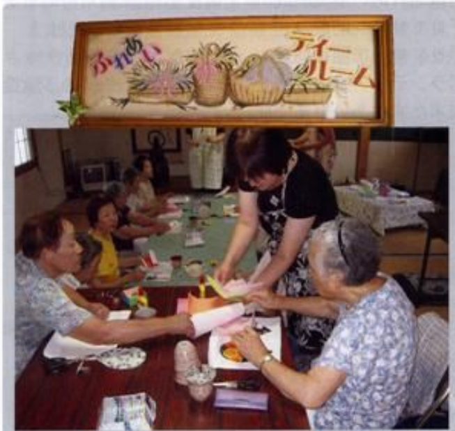
西ふれあいティールーム