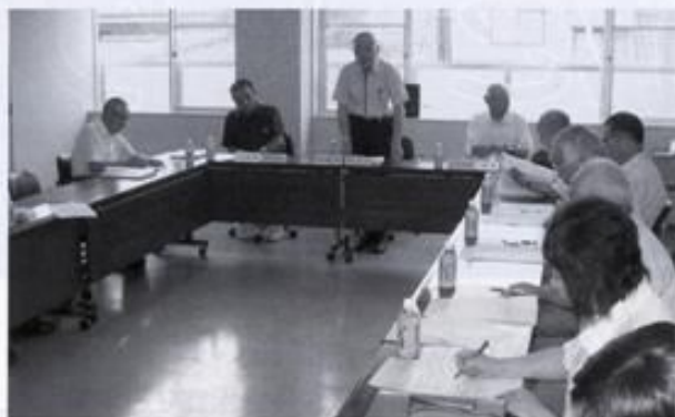
第1回事業・財政検討委員会

西区社会福祉協議会では、地域福祉の推進を図ることを目的とし、区民の皆様から会費及び共同募金等にご協力いただいた貴重な財源でそれぞれの事業を実施させていただきます。