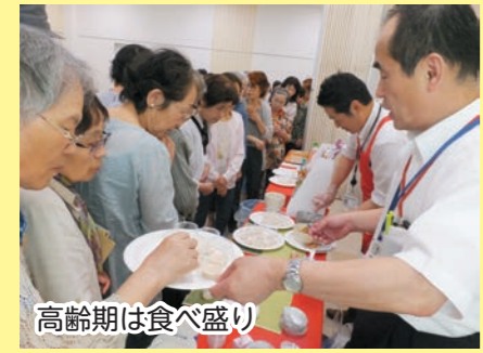
高齢期は食べ盛り