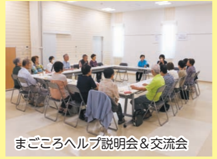
まごころヘルプ説明会&交流会