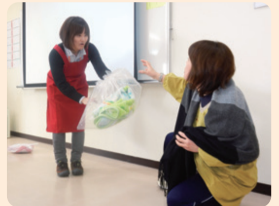
▲認知症サポーター養成講座

★開催の前月20日 から申込受付を開始します。(休日の場合は翌日から) ※例えば1月の講座は、12月20日から受付開始です