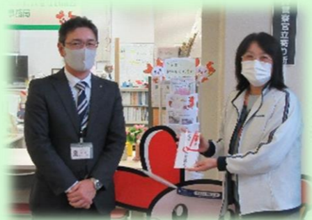
興栄信用組合様よりご寄付をいただきました。