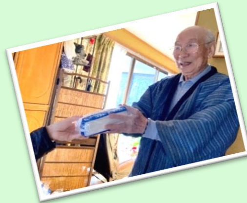
✦見守りを兼ねてマスクをお渡ししました。

お届けした方からは「ありがとう」、「赤飯っておいしいんだね」など、温かいお声をいただいたそうです。今年度も新型コロナウイルス感染症の影響で普段の行事を行うことが難しいため、昨年度同様に訪問型の行事を企画しているとのこと。