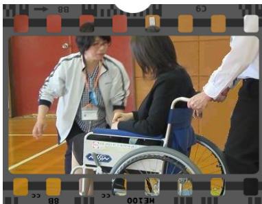
☆清心中学校：車椅子体験

☆小・中学校の総合学習では、福祉とは「 ふ だんの く らしの し あわせ」であること、そのために地域でどのような取り組みが行われているのかを紹介しています。また、高齢者疑似体験や車いす、ユニバーサルデザインに実際にふれるなどの体験学習も行っています。学習を通して、相手の困りごとに気づき、思いやりの気持ちをもって行動できる人になって欲しいとメッセージを送っています。