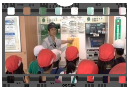
☆内野小学校：ユニバーサルデザイン体験

☆小・中学校の総合学習では、福祉とは「 ふ だんの く らしの し あわせ」であること、そのために地域でどのような取り組みが行われているのかを紹介しています。また、高齢者疑似体験や車いす、ユニバーサルデザインに実際にふれるなどの体験学習も行っています。学習を通して、相手の困りごとに気づき、思いやりの気持ちをもって行動できる人になって欲しいとメッセージを送っています。